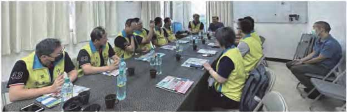
▲ 中鋼工會勞資會議、團協代表及勞資關係組理監事等11人，至全產總參訪交流及座談。