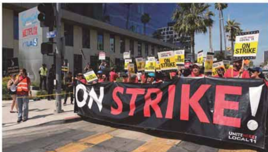
▲ 好萊塢編劇工會（WGA）罷工