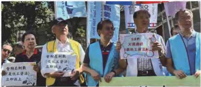
▲ 勞陣、全產總等20多個勞團，9月28日至立法院門口召開記者會，呼籲立院儘速通過「最低工資法」。

透過建立「薪資透明制度」使勞工擁有「薪資的資訊權」，以改變勞工與雇主進行薪資協商時的不利地位，進而達到縮減性別間薪資差距的目的，