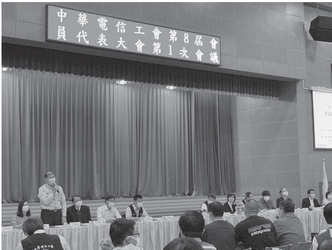
▲ 2021.3.4 江理事長出席中華電信工會第8屆會員代表大會第1次會議