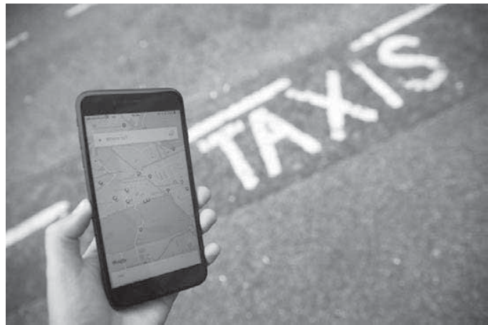
▲ 倫敦街頭uber app畫面。

該案件將會回到雇傭審判 (employment tribunal)，決定補償金額。代表 2000 位提起訴訟的 uber 司機的律師事務所表示每人可能可以拿到 12000 鎊 (約 46 萬台